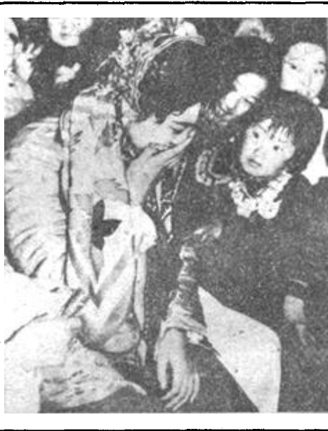
新娘娘 画连生摄影